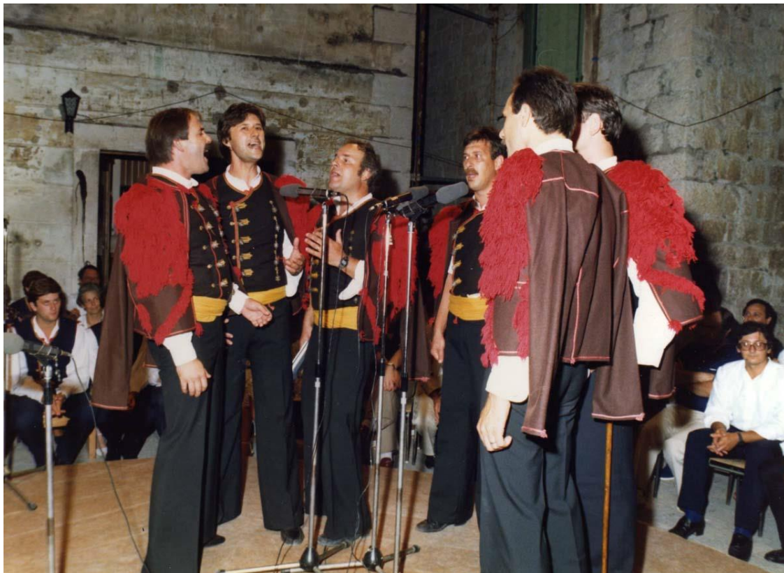
Klapa „Šibenik“ – aposlutni pobjednik 16. FDK Omiš 1982.