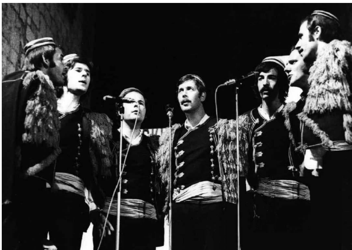
Klapa „Šibenik“ – 1. nagrada stručnog žirija na 9. FDK Omiš 1975.